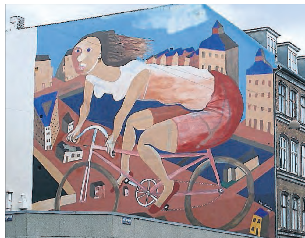
Seppo Mattinen: Gavlmaleri af cyklende kvinde fra Nørrebrogade 14 i København.